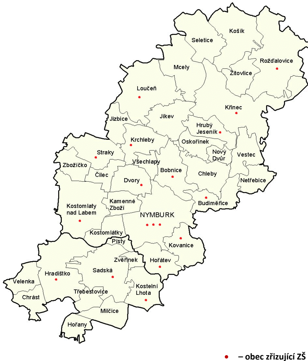
Mapa č. 2: Území ORP Nymburk

Obec s rozšířenou působností Nymburk má ve svém správním obvodu 39 obcí. Základní školy najdeme v 15-ti z nich, přičemž město Nymburk má 3. Ve výsledku se tedy jedná o 18 škol analyzovaných v rámci projektu. V deseti případech jsou základní školy spojené se školami mateřskými.